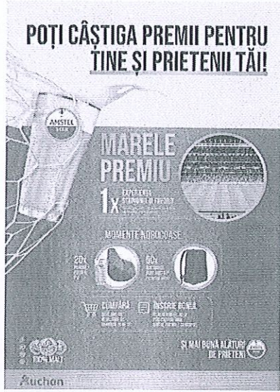
Anexa nr. 3 Imaginea Premiilor Campaniei